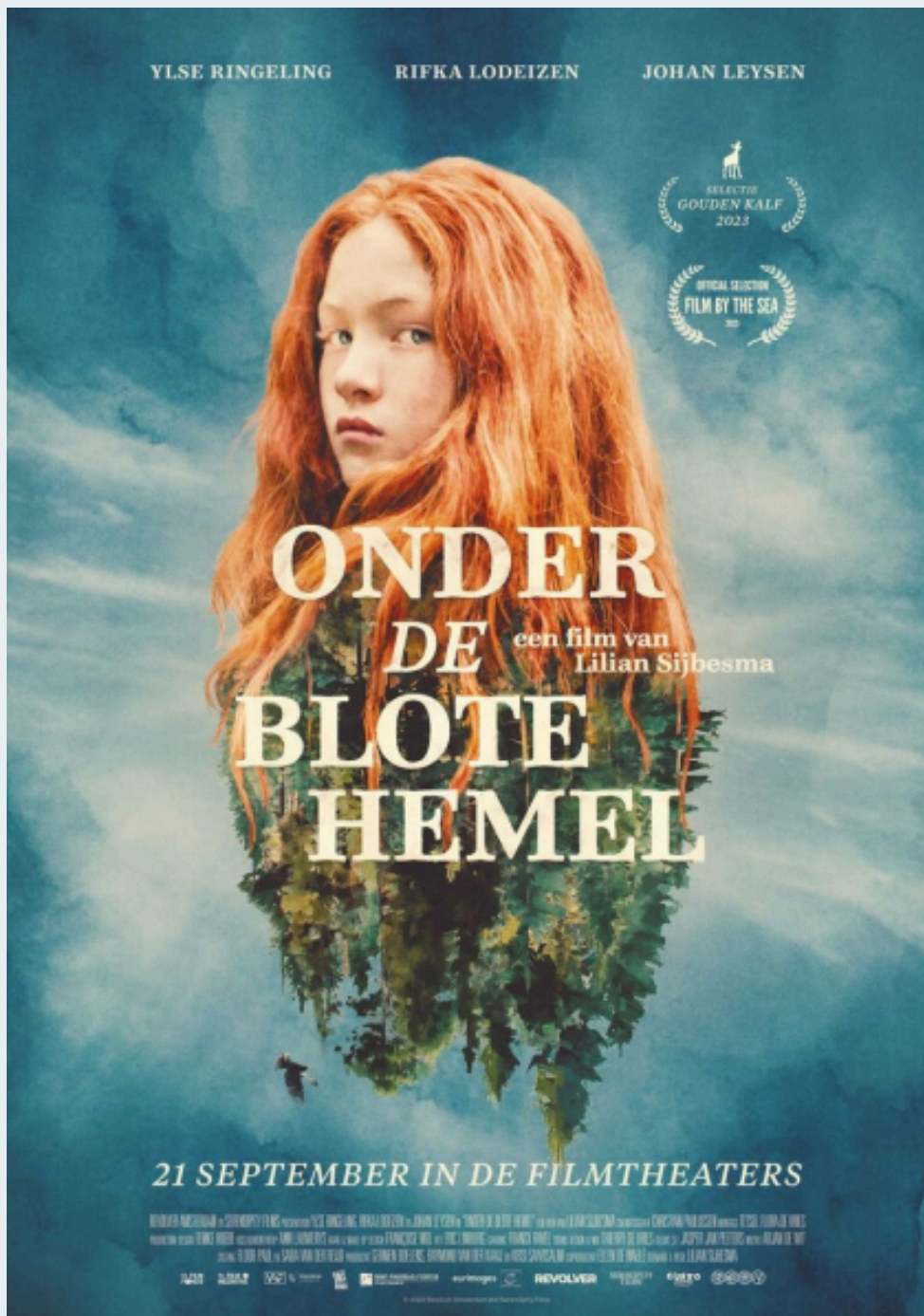
© 2024 FILM BY THE SEA